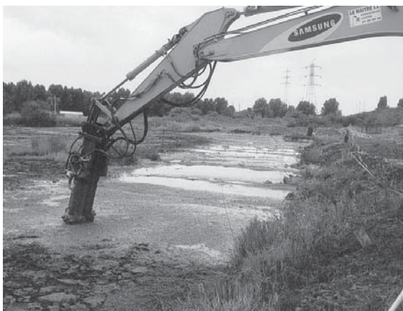
Obr. č. 2.1.2-7 Použití specifického zařízení pro stabilizaci a solidifikaci materiálů v kalových lagunách (materiál společnosti Soletanche Česká republika, s. r. o., 2005)